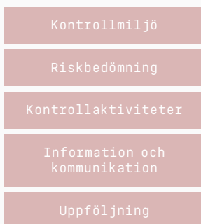
Ramverket för intern kontroll

utbildningar under året. Projekt har även drivits för att fullt ut harmonisera Semconkoncernens finansiella processer bland alla dotterföretagen.