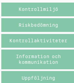
Ramverket för intern kontroll

Semcons riskbedömning avseende den finansiella rapporteringen - det vill säga identifiering och utvärdering av de väsentligaste riskerna i koncernens bolag, affärsområden och processer avseende den finansiella rapporteringen - utgör underlag för hur dessa ska hanteras. Hanteringen sker genom att riskerna antingen accepteras eller reduceras alternativt elimineras. De årliga utvärderingsaktiviteterna utförs av funktionen för intern kontroll och baseras på en riskbaserad modell. Bedömningen av vilken grad av risk som föreligger för att det ska uppstå felaktigheter i den finansiella rapporteringen sker utifrån en rad kriterier. Komplexa redovisningsprinciper kan till exempel innebära att den finansiella rapporteringen riskerar att bli felaktig för de poster som omfattas av sådana principer. Värdering av en viss tillgång eller skuld utifrån olika bedömningskriterier kan