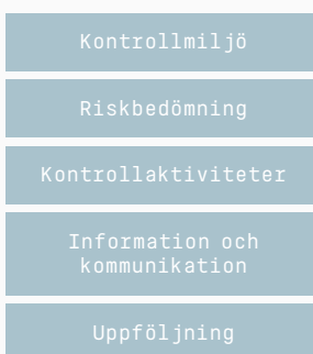
Ramverket för intern kontroll

Semcons riskbedömning avseende den finansiella rapporteringen - det vill säga identifiering och utvärdering av de väsentligaste riskerna i koncernens bolag, affärsområden och processer avseende den finansiella rapporteringen - utgör underlag för hur dessa ska hanteras. Hanteringen sker genom att riskerna antingen accepteras eller reduceras alternativt elimineras. De årliga utvärderingsaktiviteterna utförs av funktionen för intern kontroll och baseras på en riskbaserad modell. Bedömningen av vilken grad av risk som föreligger för att det ska uppstå felaktigheter i den finansiella rapporteringen sker utifrån en rad kriterier. Komplexa redovisningsprinciper kan till exempel innebära att den finansiella rapporteringen riskerar att bli felaktig för de poster som omfattas av sådana principer. Värdering av en viss tillgång eller skuld utifrån olika bedömningskriterier kan