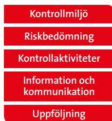
Ramverket för intern kontroll

Semcons riskbedömning avseende den finansiella rapporteringen, det vill säga identifiering och utvärdering av de väsentligaste riskerna i koncernens bolag, affärsområden och processer avseende den finansiella rapporteringen, utgör underlag för hur dessa ska hanteras. Hanteringen sker genom att riskerna antingen accepteras eller reduceras alternativt elimineras. De årliga utvärderingsaktiviteterna utförs av funktionen för intern kontroll och baseras på en riskbaserad modell. Bedömningen av vilken grad av risk som föreligger för att det skall uppstå felaktigheter i den finansiella rapporteringen sker utifrån en rad kriterier. Komplexa redovisningsprinciper kan till exempel innebära